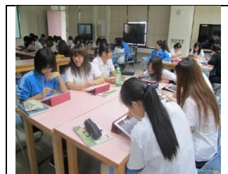
學生使用平板電腦進行學習

本校已申請為Google教育機構，提供教師容量無上限的雲端硬碟與相關雲端資源。目前校內已有許多教師陸續於課程中利用行動載具的app進行課程活動，或是利用Google Classroom等線上平台進行教學。