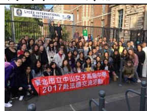
回訪里爾蒙特貝羅高中