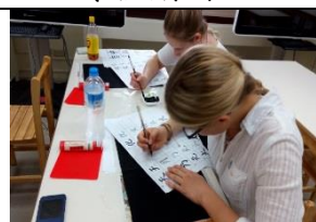
芬蘭同學體驗書法課