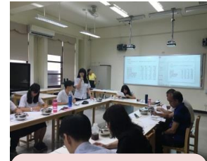
服儀委員會學生代表發言