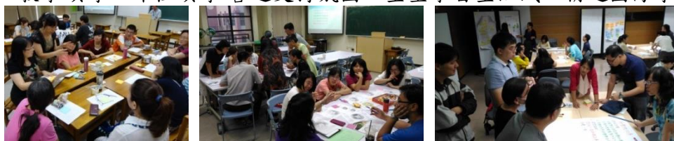
圖 54：中山女高學習型組織運作情形

(2) 有效整合資源挹注課程發展：整合校內外資源，有效協助與支持各項學習活動、成效卓著，類計至105學年度共榮獲臺北市優質學校九個向度優質獎項，106學年度爭取持續優質。