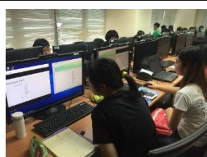
進階程式設計課程

本校自104學年度開始與國立臺北科技大學合作「教育部補助扎根高中職資訊科學教育計畫」，提供本校學生進階程式設計與資訊專題課程，並辦理多場資訊領域相關講座與企業參訪，參與計畫的學生擁有程式設計基礎後可參加APCS檢測，做為大學申請時的證明與優勢。