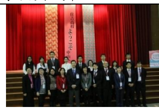
住吉高校來訪：雙方師長合影