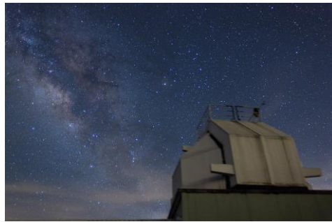
天文攝影－星野攝影