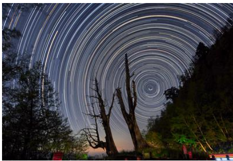
天文攝影－星軌攝影