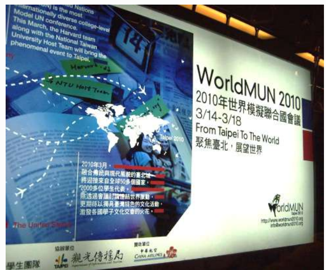
▲ 2010 年會議結合城市行銷的捷運燈箱