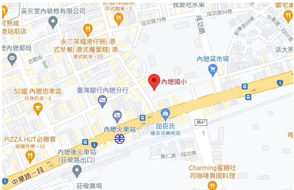
▲ 桃園市內壢國小-地理位置圖