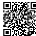
112年金融基礎教育推廣計畫