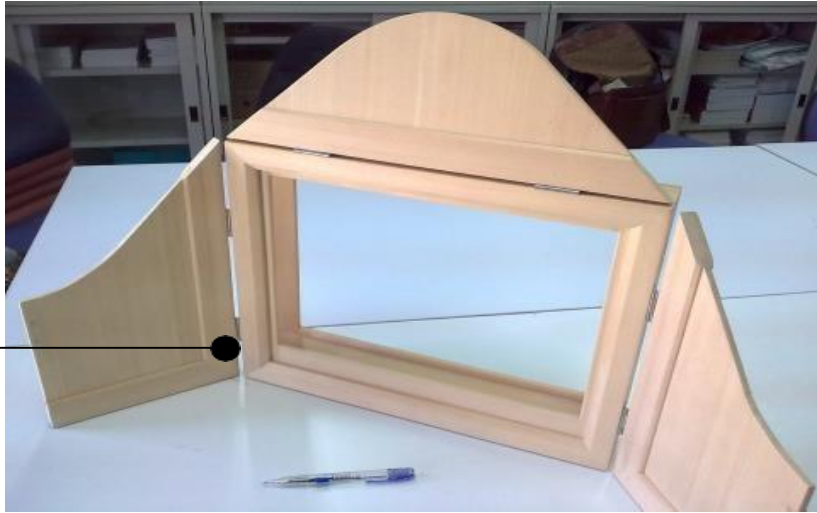
圖卡經由左方進行抽換。