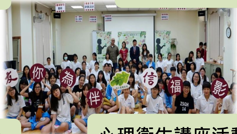
心理衛生講座活動