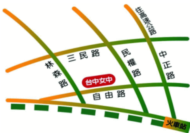
臺中市立臺中女子高級中等學校 110 學年度校園配置圖

※校內不開放停車，請搭乘大眾運輸工具到校。若有需開車至該校之老師，請將車輛停放至鄰近該校之平面停車場或週邊道路停車格。