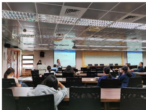
學務主任說明推動無痕飲食的意義