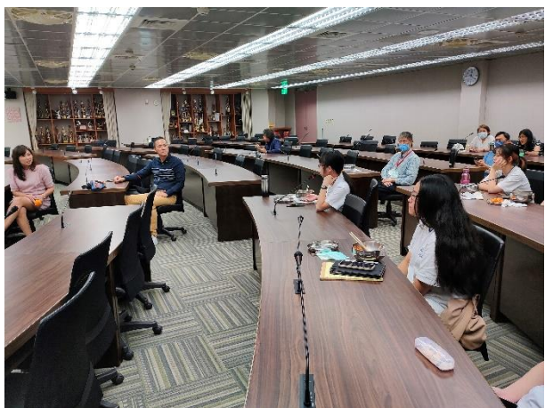
學生委員表達對無痕飲食的建議