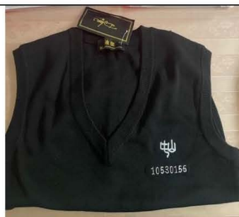
背心毛衣學號樣式