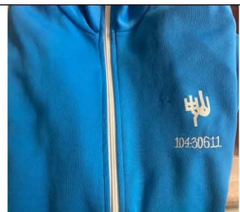
運動外套學號樣式