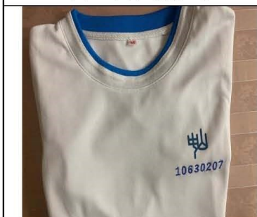
短袖運動上衣學號樣式