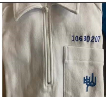
長袖運動上衣學號樣式