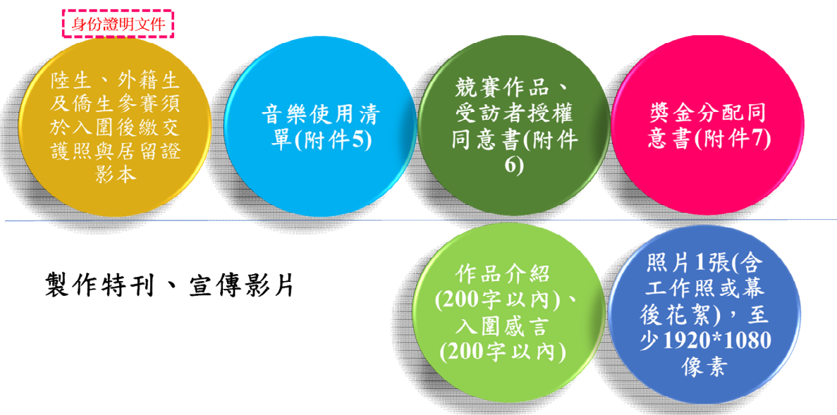
圖2：入圍提供資料示意圖