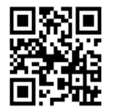
活動簡章 (營隊梯次)