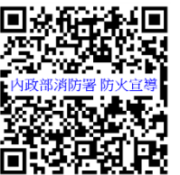
內政部消防署 防火宣導