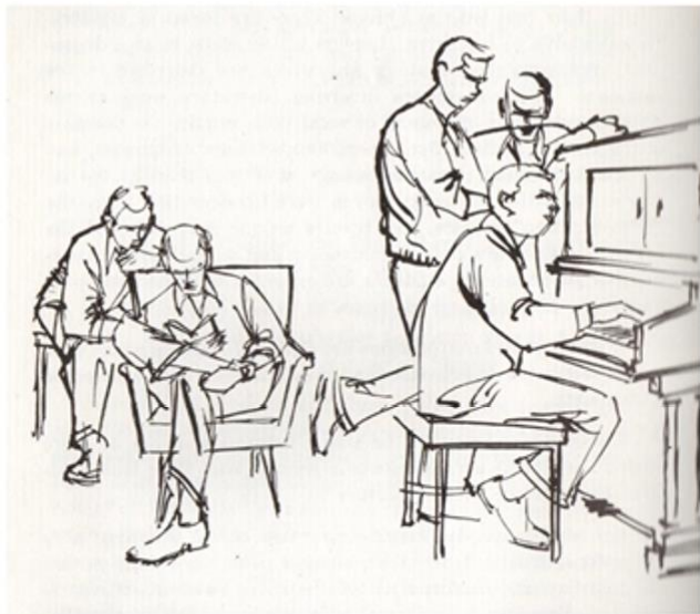
1960年，夏默學院手冊中學生生活的理想描繪。