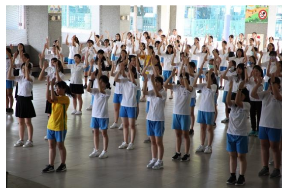
九月高一有氧舞蹈教學與練習