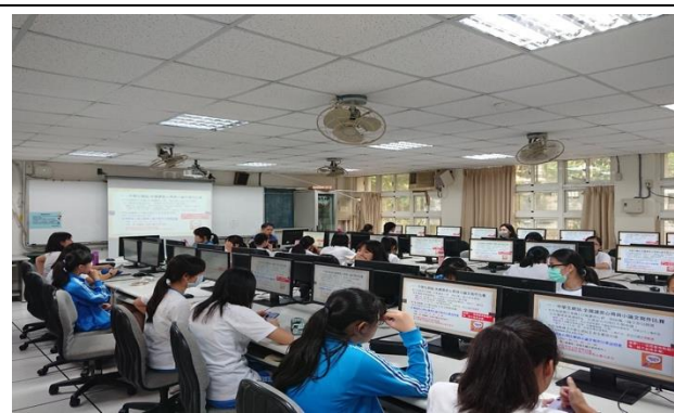
0907 自主學習前導課程