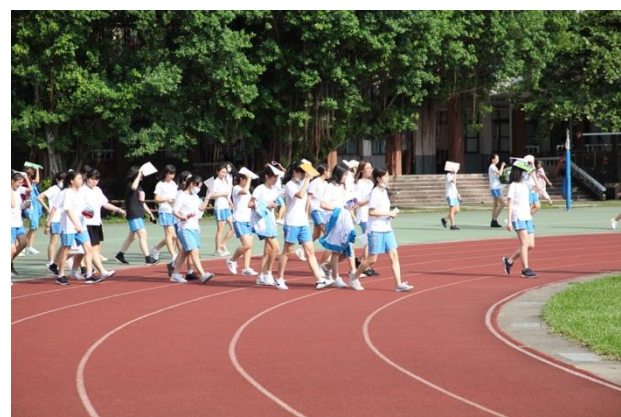
九月地震避難演習