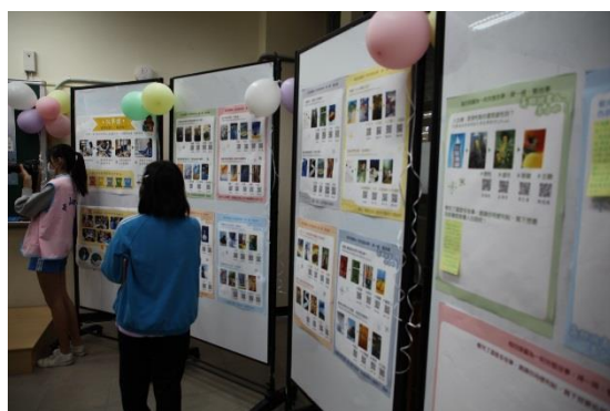
1205 123 校慶學科展