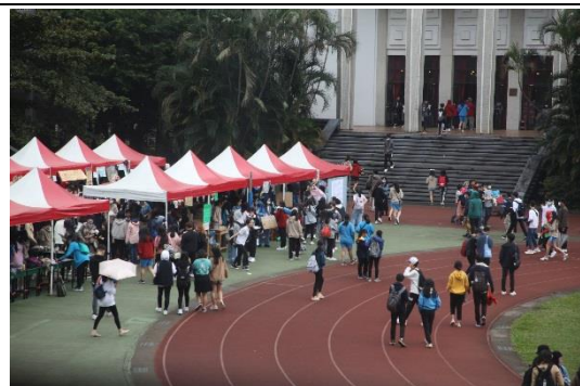
1205 123 校慶園遊會