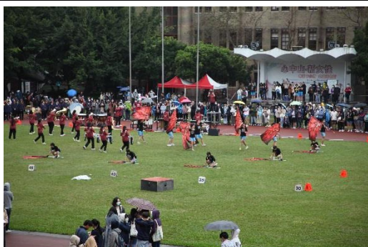
1205 123 校慶表演