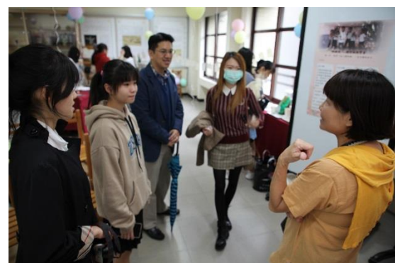
1205 123 校慶學科展