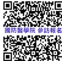
國防醫學院參訪報名

歡迎有意願的同學於線上表單報名，並至教官室領取「家長同意書」，請於 11 月 6 日前將同意書及午餐自費 52 元(多退少補)繳至教官室徐教官，完成報名手續。(活動流程表，如附件)