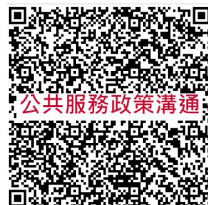
公共服務政策溝通