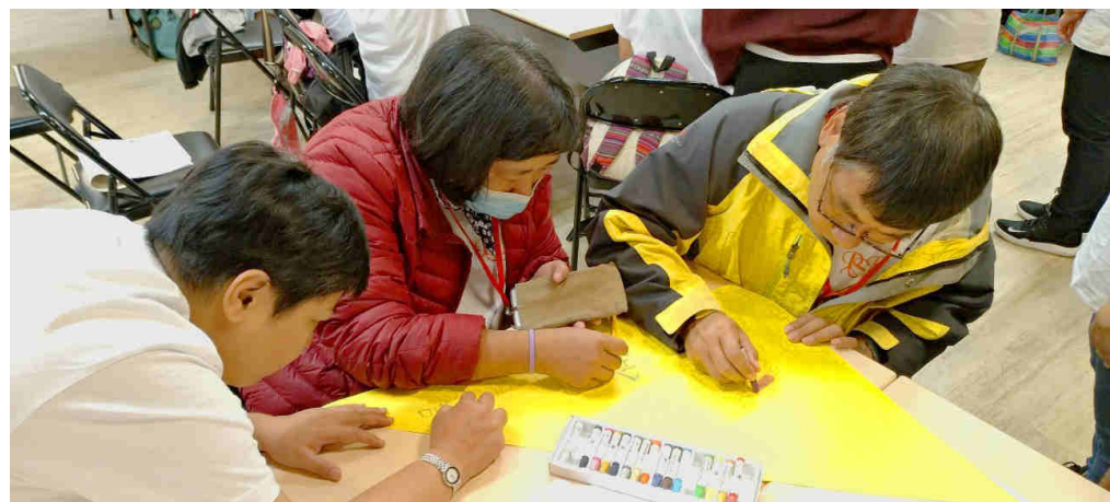
▲ 精障青年們彼此合作畫出代表自己對五的圖案。