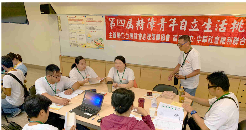
▲ 彼此針對目標互相討論發表意見。

理事長提到要讓精障青年們感受到「現實感」，在生活中給予找方法的方式，相信自己是具有實踐夢想的權利、能力以及自由，支持者們則從旁一起協助找到答案，當最有力的靠山，給予最大的支持與鼓勵。