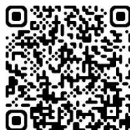
生物科學營影片簡介