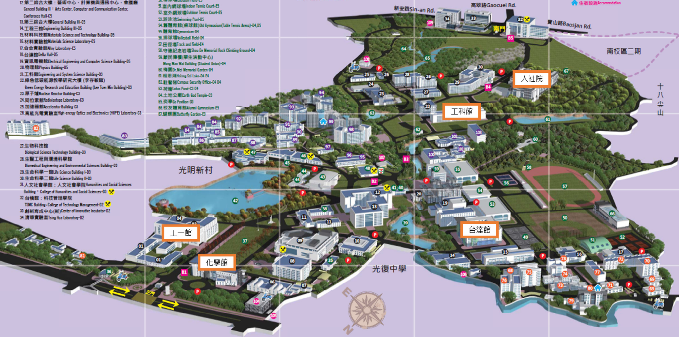
國立清華大學校園導覽圖 NTHU Campus Map