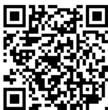
報名系統 QR code