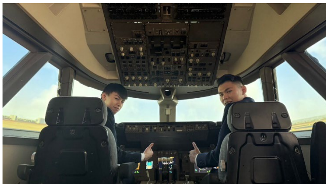
波音 B747-400 模擬機