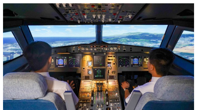
空中巴士 A320 模擬機