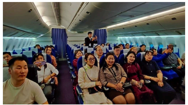
波音 B777 飛航情境模擬機