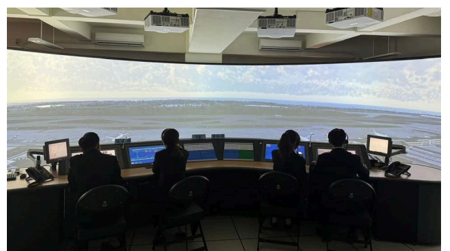
航管塔台與雷達模擬教室

九、報名網址： https://forms.gle/BPPVP8svgQUd9pw76 /聯絡信箱： cadfcyut@gmail.com