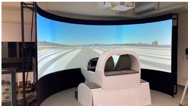
DA40/42 單引擎與雙引擎螺旋槳模擬機各一