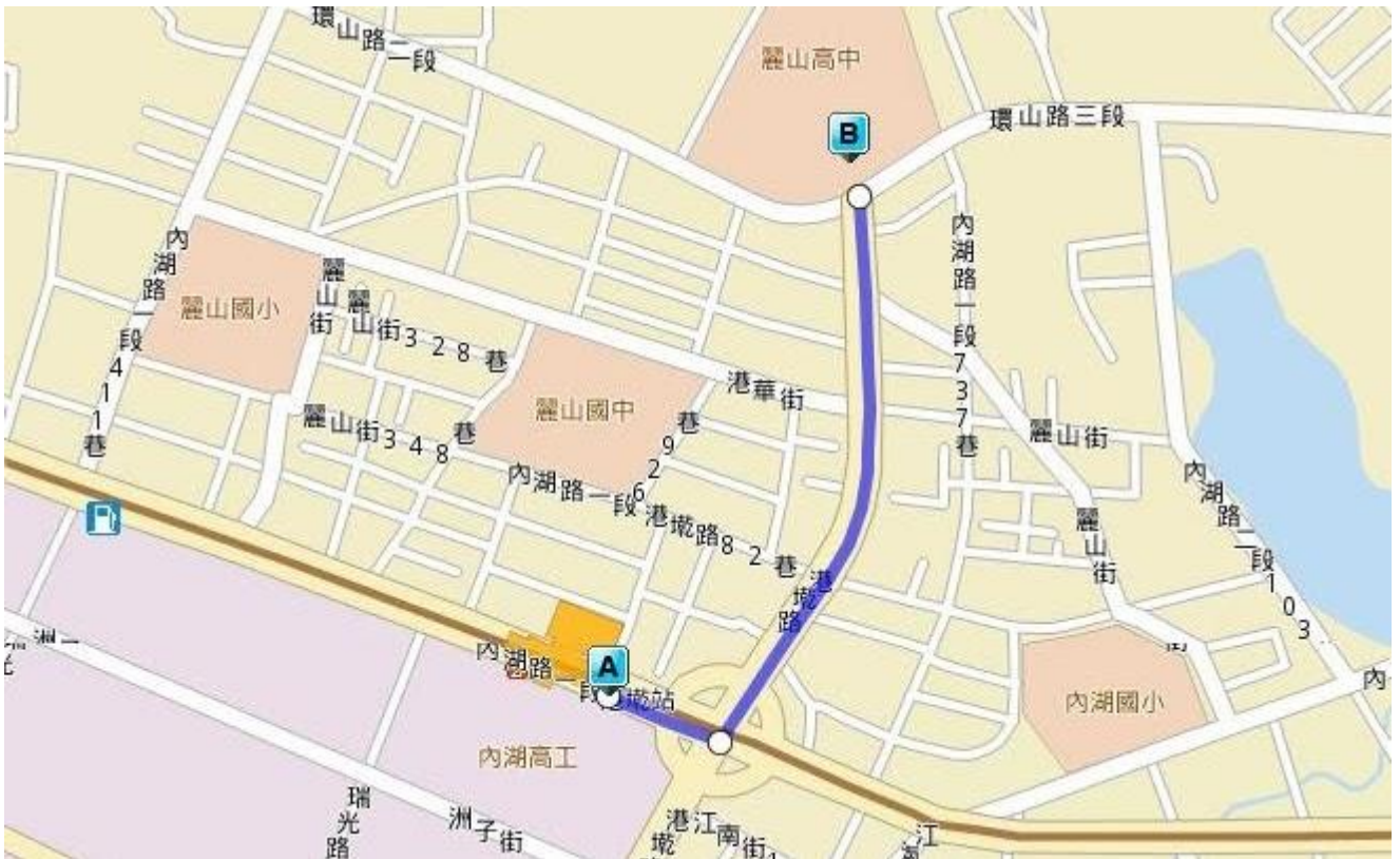
A—捷運港墘站(內湖高工) B—麗山高中