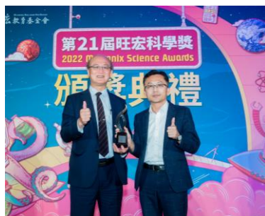
教育部次長林騰蛟多次出席活動，並鼓勵獲獎學校