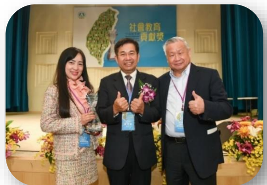
2021年由教育部潘文忠部長頒授 「社會教育貢獻獎」肯定

「旺宏科學獎」強調創新，希望打造公平公正公開的競賽平臺，並透過高額獎學金制度，激發每位參賽同學的創意潛能。期許未來能持續影響年輕世代勇敢天馬行空，務實動手實踐，厚植臺灣基礎科學實力。