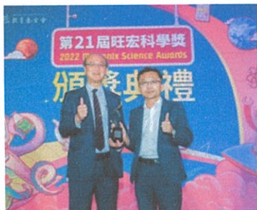
教育部次長林騰蛟多次出席活動給予指導與鼓勵