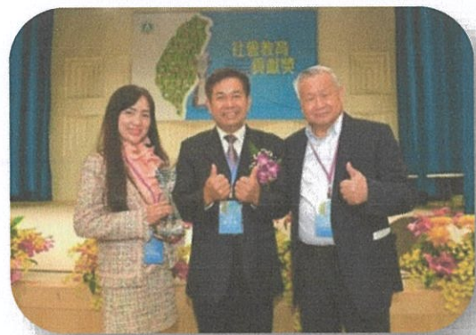
因長期致力推廣科學教育，旺宏教育基金會由教育部潘文忠部長頒授「社會教育貢獻獎」的榮耀肯定

旺宏教育基金會自2015年起，針對高中教師更持續推動「閱讀科學找樂子」及「科學教師研習營」，希望透過提供高中教師們更實質的協助，以扎根高中基礎科學教育。