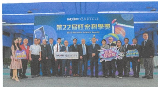
產官學研界貴賓擔任頒獎人為獲獎師生團隊傑出表現喝采