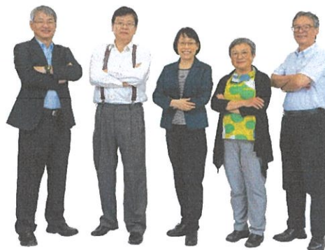
旺宏科學獎評審團陣容堅強